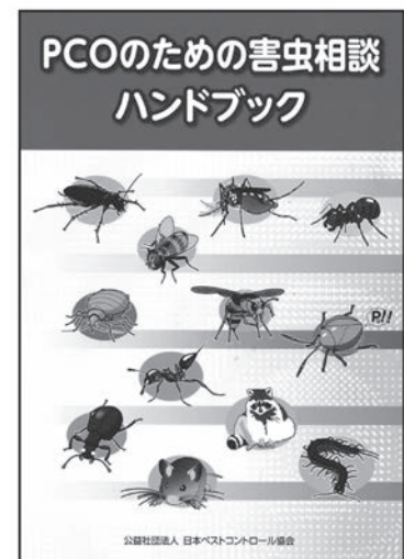
図3 PCOのための害虫相談ハンドブック