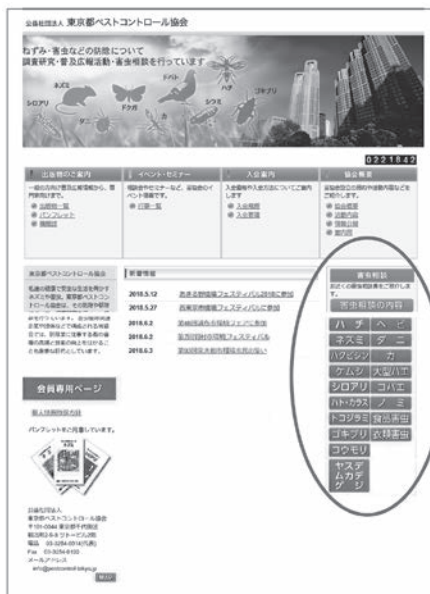
図1 HPの害虫相談 (○内)