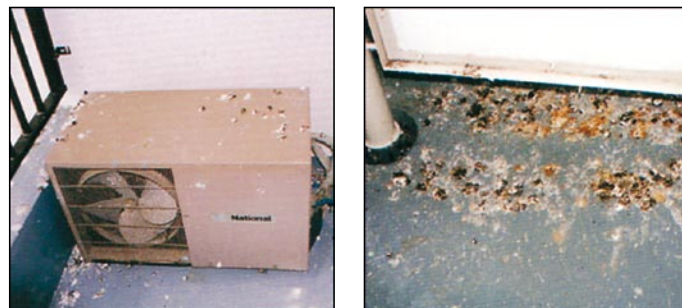
フンによる被害状況

たり、巣のフン・死体・卵などが腐敗し、悪臭や害虫発生の原因になる場合があります。