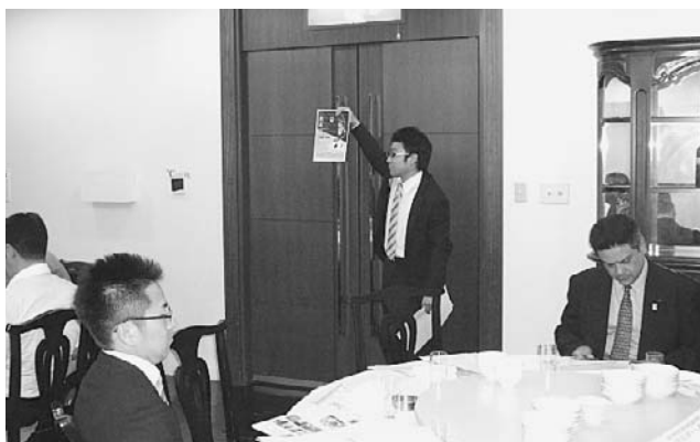
賛助会員による資料説明