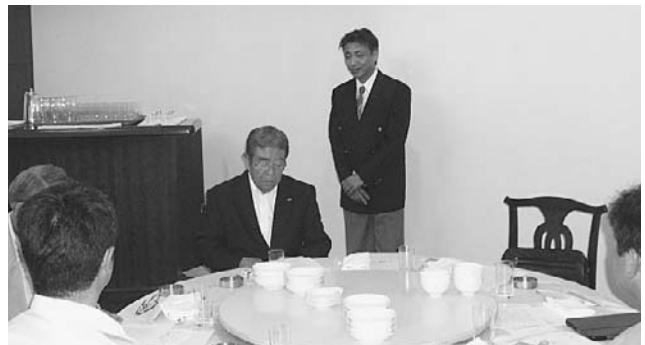
金子司会者の開会挨拶