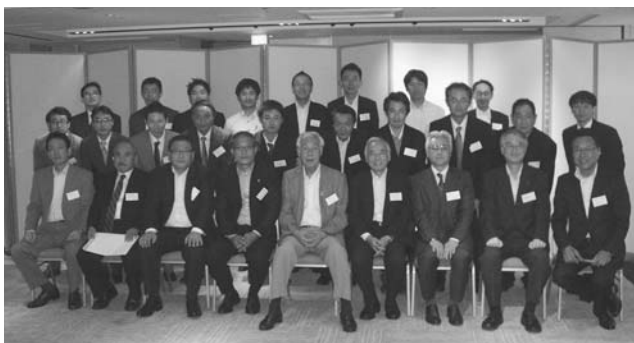
参加者全員揃って