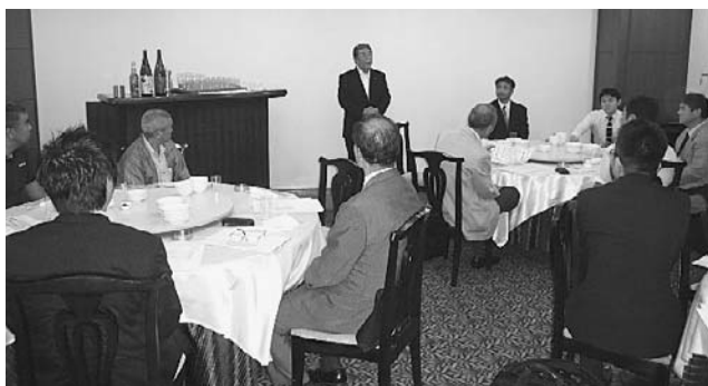
新沼副会長の報告