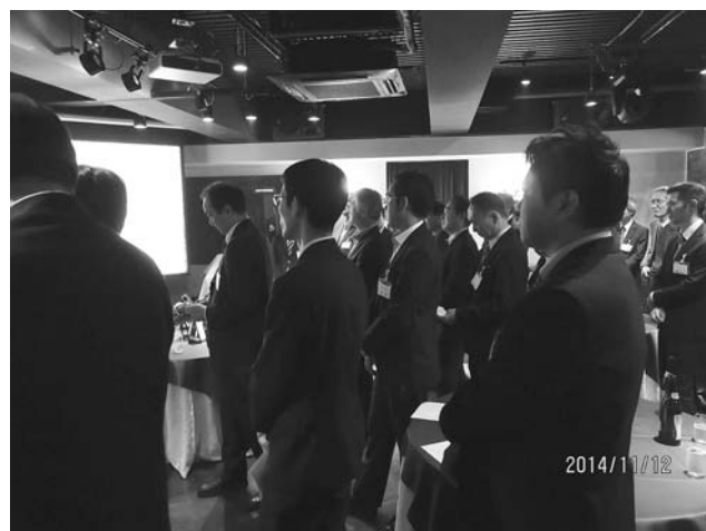
会長等の説明・報告を聞く出席者