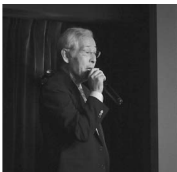
デング熱媒介蚊駆除についての協会の取組を説明する会長