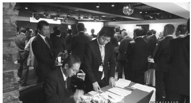
ブロック会の受付風景